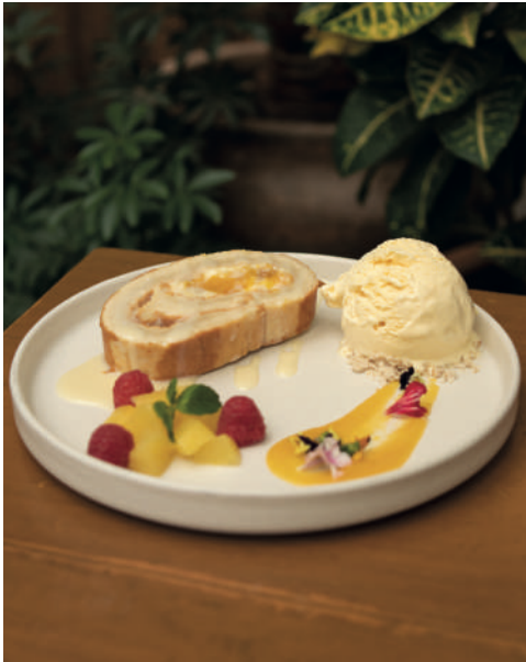
ROLL CAKE MANGO $149 Bizcocho natural relleno de ganache de chocolate blanco y mermelada de mango con chabacano.